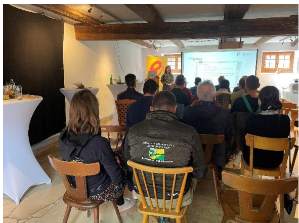
Abbildung 6: Start des ERFAs im Woferl Stall