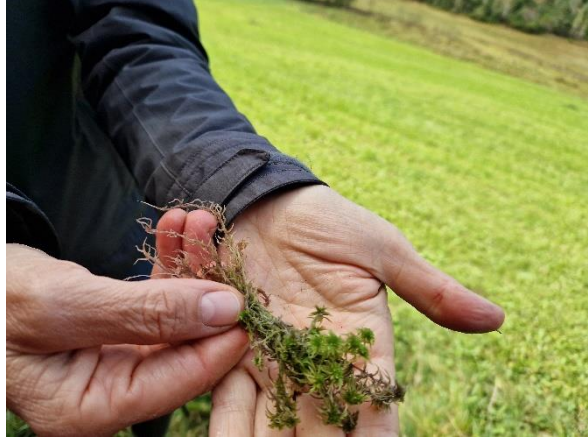
Abbildung 14-17: Eindrücke von der Moorexkursion