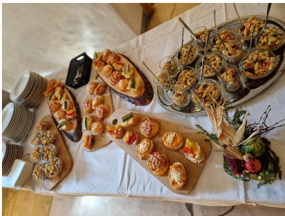
Abbildung 5: Regionales Buffet im Woferl Stall