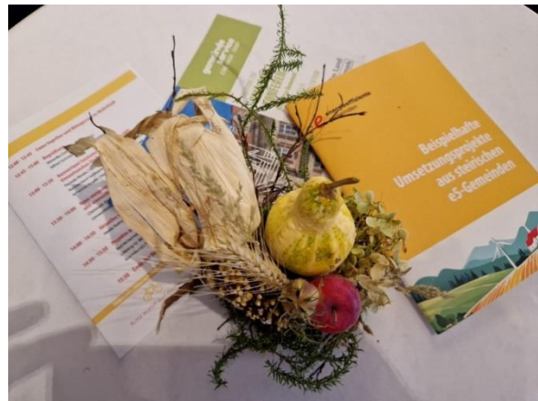
Abbildung 4: e5-ERFA Badmitterndorf