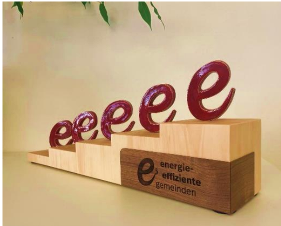
Abbildung 11: Neue Auszeichnungstrophäe

Die Treppe ist aus steirischem Zirbenholz gefertigt, die e's wurden aus Keramik in Kärnten hergestellt. Die Verleihung erfolgt ab den Audits 2024. Die „alten“ Auszeichnungstrophäen verbleiben in den Gemeinden.