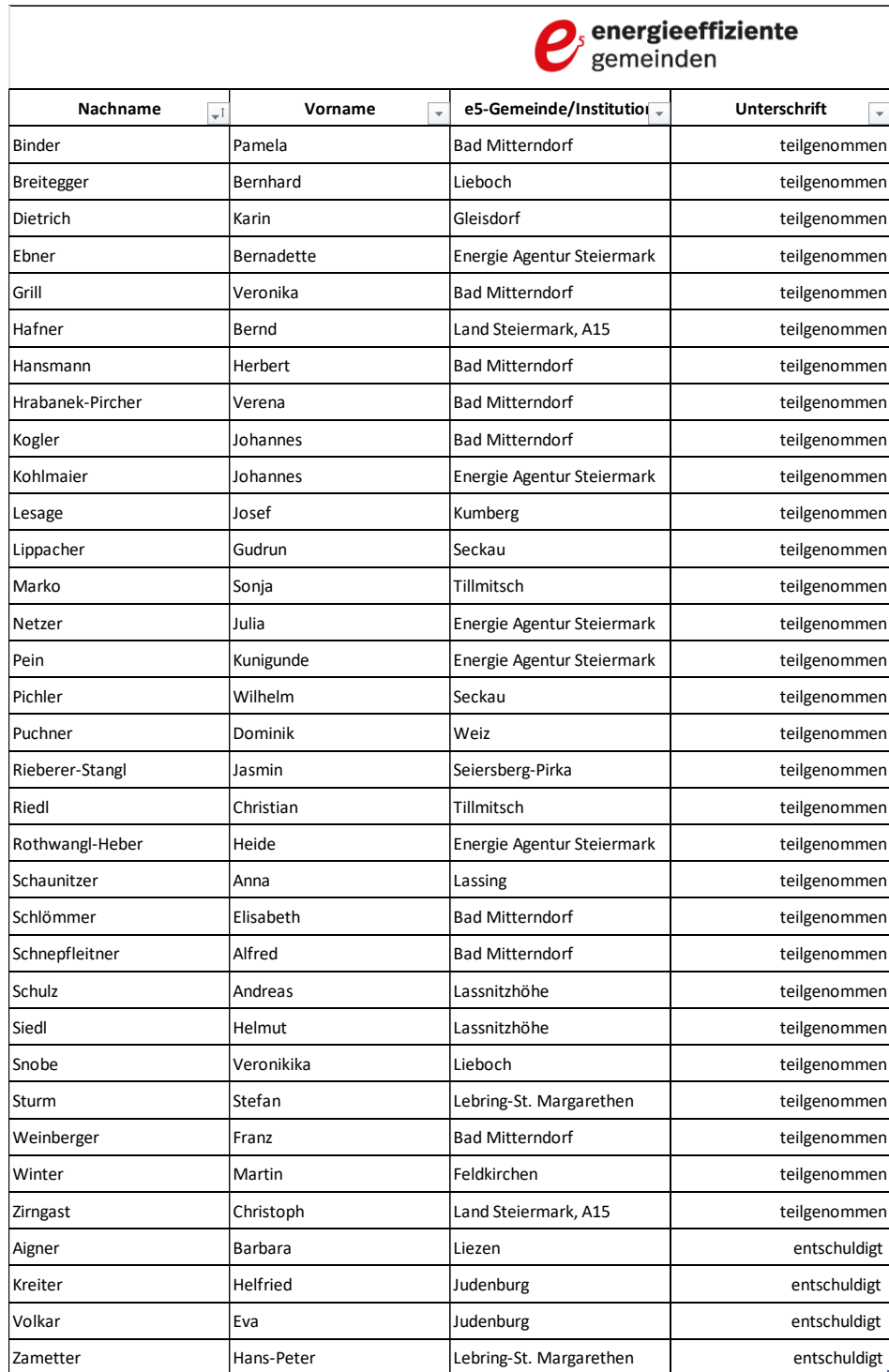
Tabelle 1: Teilnehmer:innen-Liste