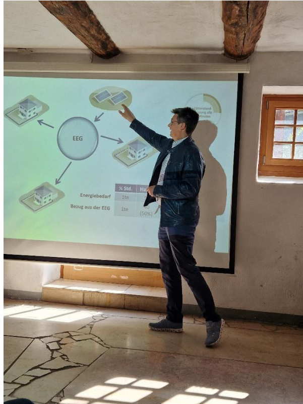
Abbildung 13: Erfahrungsbericht zu erneuerbaren Energiegemeinschaften

Titel des Vortrags: Erneuerbare Energiegemeinschaft Lebring-St.Margarethen